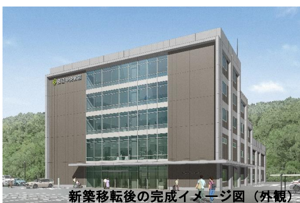
新築移転後の完成イメージ図 (外観)