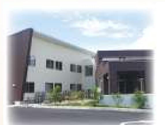
田辺すみれハイム

平成26年9月に開設され、自分らしい暮らしが尊重されるよう、50戸の各居室全室完全個室となっています。