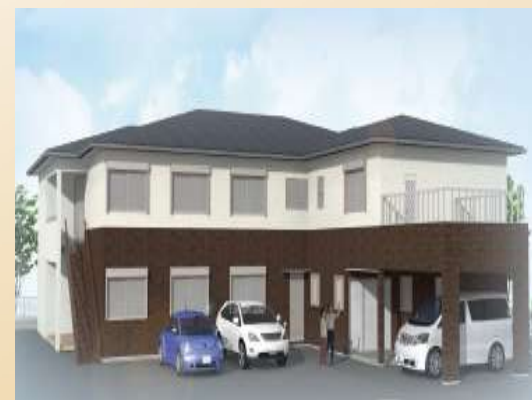
田辺すみれホーム

平成27年4月に開設され、田辺すみれハイムに隣接した、2ユニット18床の認知症対応型共同生活介護(グループホーム)であり、地域の皆様が安全で安心して生活ができるスペースをご提供します。