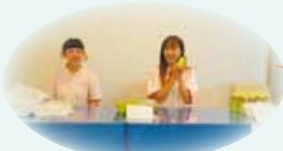
受付 医事課スタッフ