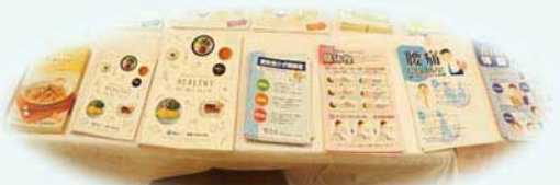
各種パンフレット配布

盛況のうちにフェアは終了しました。今回ご来場いただきました多くの皆 様に心より感謝いたします。ありがとうございました。