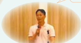
司会進行 放射線科