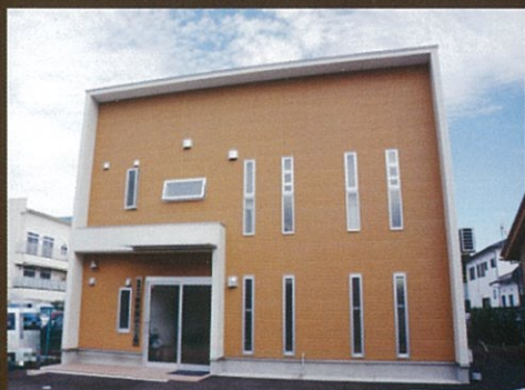
田辺中央病院 グループ本部に開設