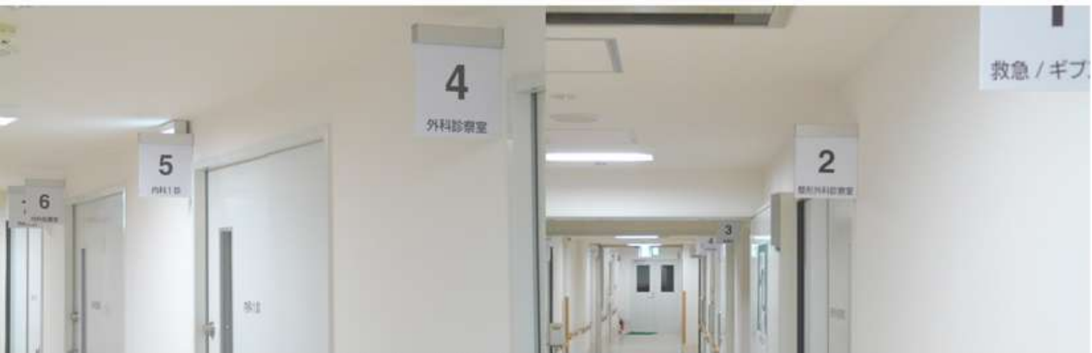
手前から、救急/ギブス室、整形外科、外科、内科1診、内科2診となりました。