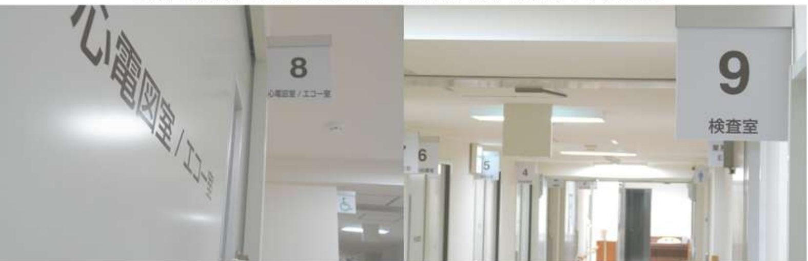
2階にあった検査室を1階に移動し、機器も一新しました。