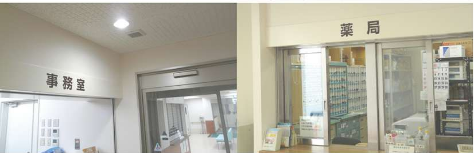
事務所・薬局・お薬の待合室を、別棟として新たに設けました。